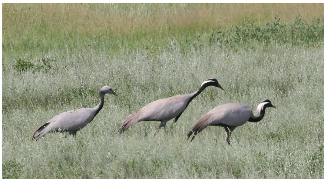
Рис. 4. Семейная группа красавок в окрестностях озера Беле в начале августа 2020 г.