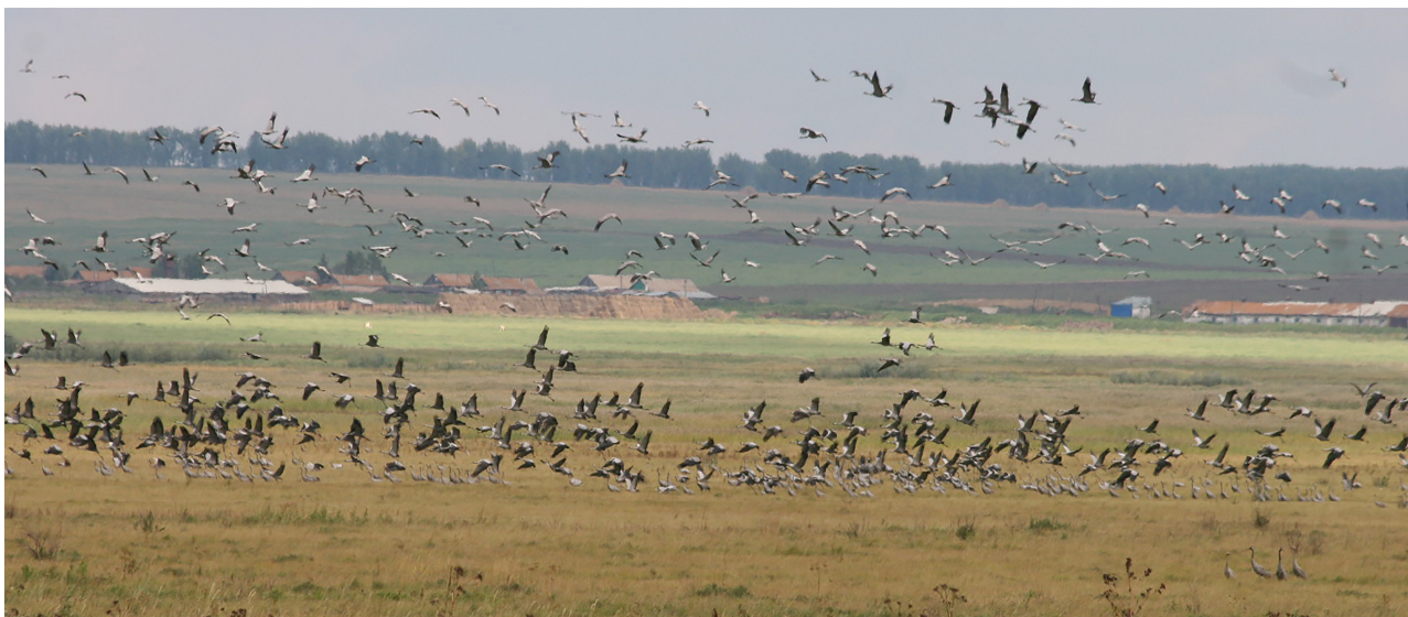
Рис. 3. Фрагмент скопления журавлей в районе Марьясова болота в августе 2015 г.