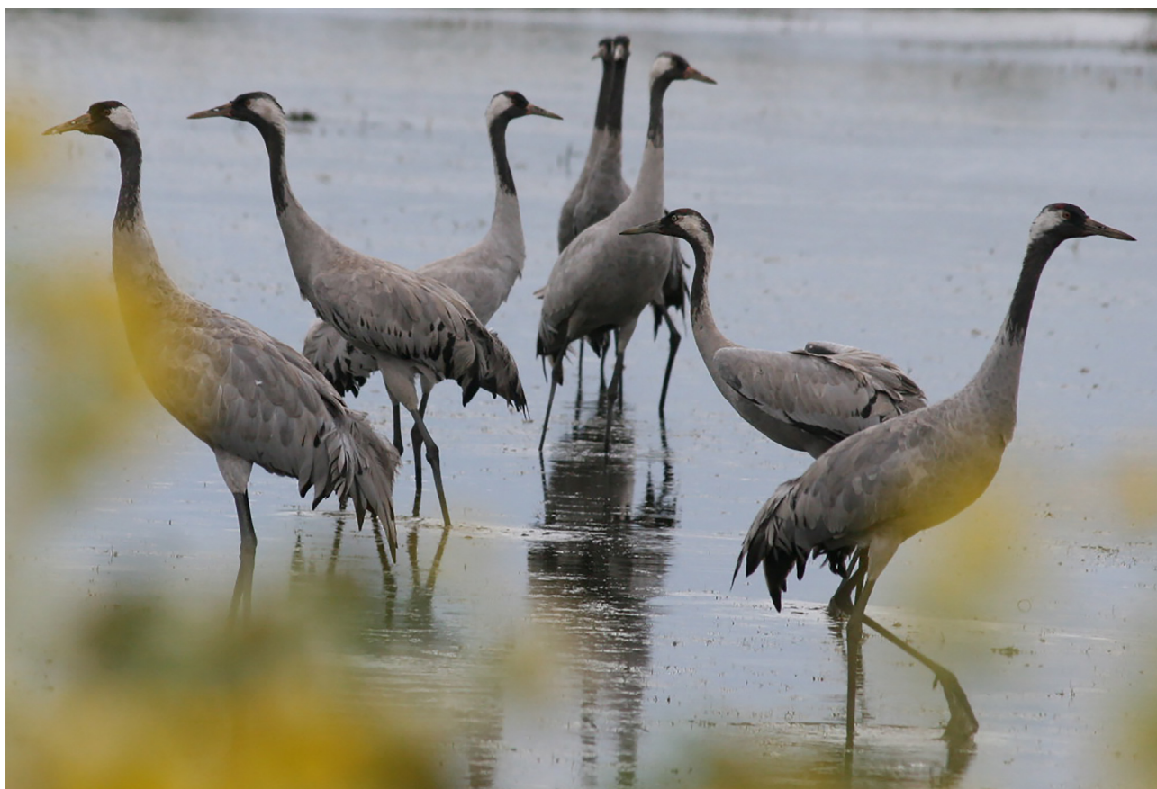
Рис. 2. Серые журавли на дневке в районе оз. Салбат. Август, 2016 г.