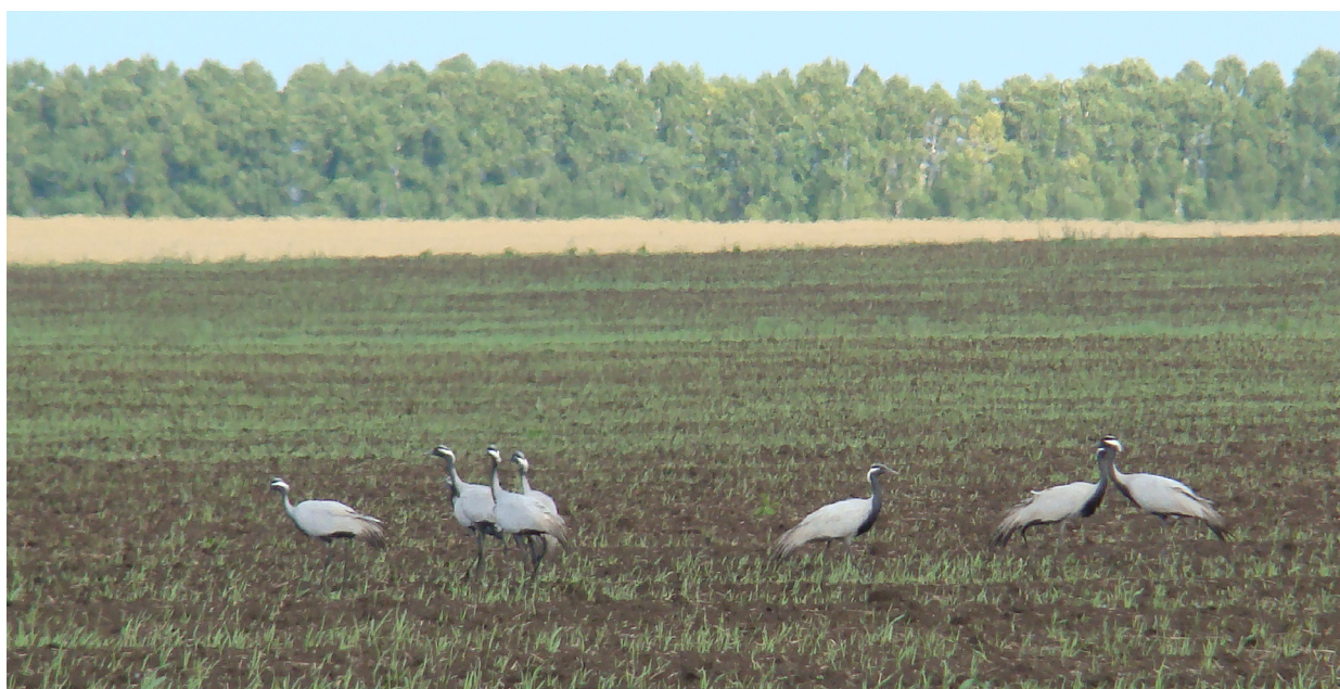
Рис. 5. Журавли-красавки кормятся на озимях в районе оз. Паниха, август 2020 г.

Другие известные места скоплений находились ранее в основном в Хакасии, однако в последние годы красавки стали чаще встречаться в Ачинской лесостепи. Отдельные их группы численностью до 100 особей были отмечены у озер Большой Косоголь, Салбат, Интиколь, Паниха и на Марьясовом болоте (рис. 5).