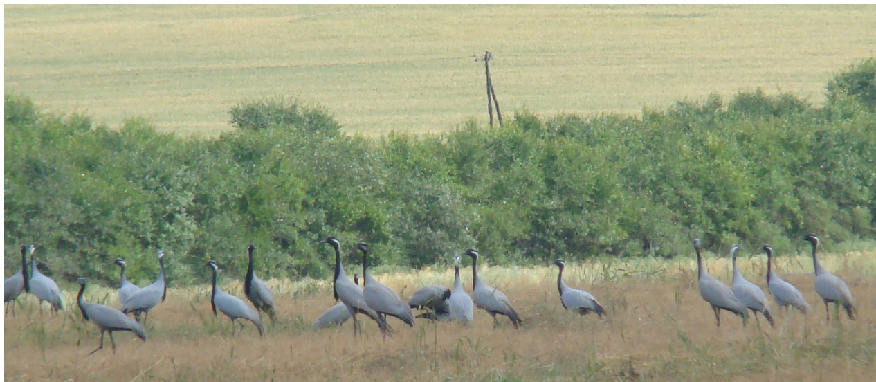
Рис. 6. Фрагмент скопления красавки в окрестностях оз. Беле. Третья декада августа 2012 г.

нец августа (рис. 6). Однако стоит отметить, что образование скопления в более ранние сроки (с третьей декады мая), вероятно, связано с неудачным гнездованием птиц в текущем году.